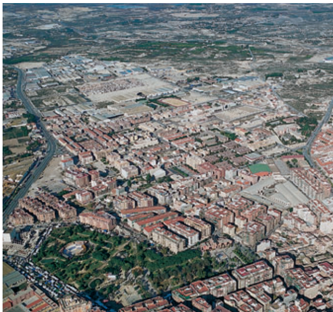
Molina de Segura.

Las ciudades de la Región de Murcia han tenido, a lo largo de los años, una evolución semejante a las del resto de España. Actualmente son grandes centros impulsores de la actividad económica e introductores de innovaciones. Han experimentado un importante crecimiento y gran parte de la población murciana vive en ciudades, sobre todo en el área metropolitana de Murcia.